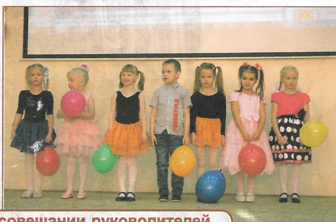
Приветствие детей на совещании руководителей школ и детских садов Мезенского района

Учредитель: МБДОУ «Детский сад «Улыбка».