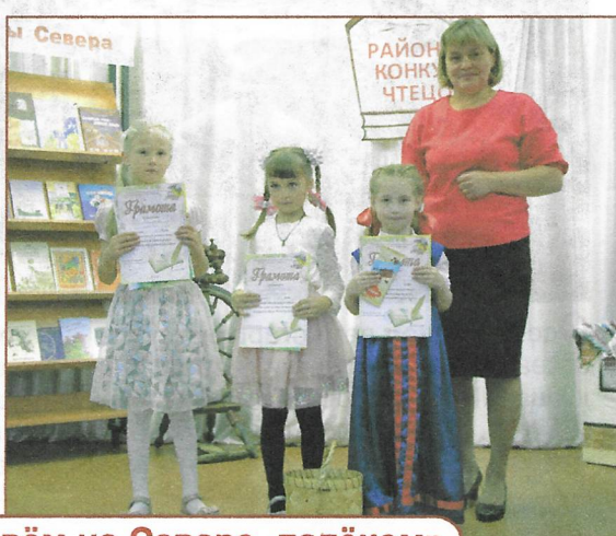
Районный конкурс чтецов «Мы живём на Севере далёком»